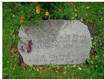
Taip paminklas atrodė 2008 m.