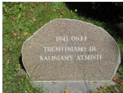
Taip atrod 2013 m.