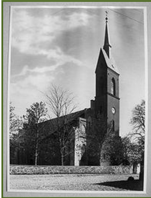
Senoji evangelik liuteron bažny ia ir jos liekanos – pamatai, altoriaus vieta