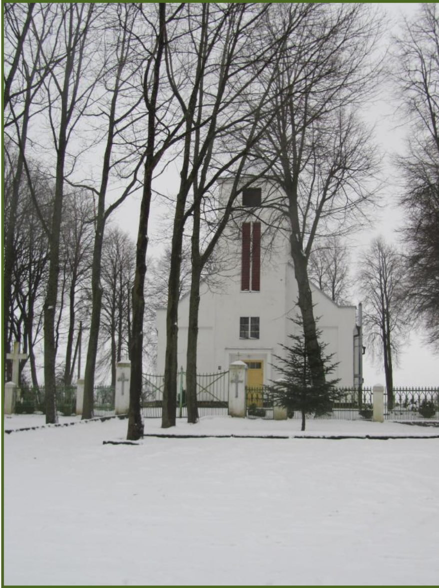
Šv. Antano Paduvie io katalik bažny ia