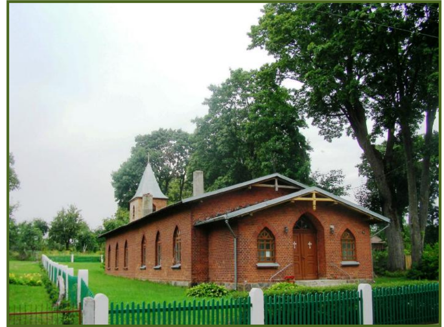
Dabartin evangelik liuteron bažny ia – buv evangelik liuteron parapijos namai

Senoji evangelik liuteron bažny ia pastatyta 1693 m. istoriniame gyvenviet s centre, pie iau Turgaus gatv s – senojo vieškelio ir Drevernos-Kint kelio sankryžoje. Apie 1821 m. išm rytas bokštas. II- ojo pasaulinio karo pabaigoje buvo apgriauta, o 6 deš. visai nuardyta. Tikintieji bažny i sireng buvusiuose parapijos namuose