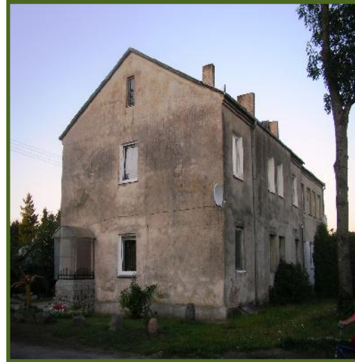
Buvusi baptist bažny ia